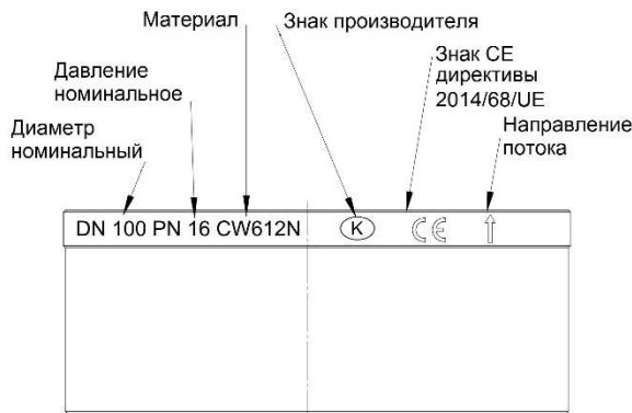
Латунь Н DN 15-100 Знак CE від DN 65